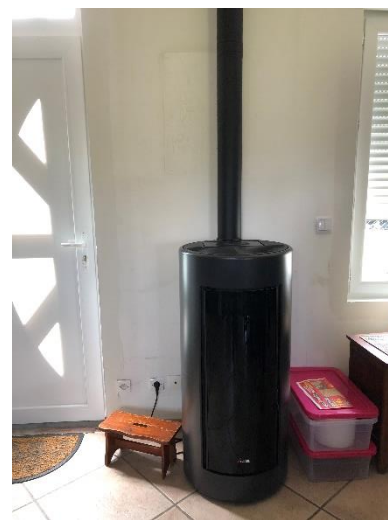
Changement de fenêtre, installation d'un poêle à granulés, tout est possible afin de lutter contre la précarité énergétique.